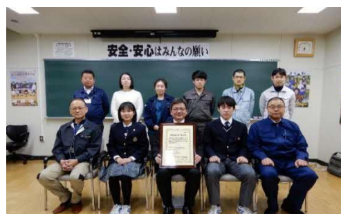
農場 HACCP の取得(酪農・食品系列)

平成31年1月より、標茶町、JA標茶、農業改良普及センター、北海道ひがし農業共済組合の協力を得て「標茶高校農場 HACCP 準備会」を立ち上げ、毎月準備会を重ね、令和元年11月に中央畜産会へ申請を行った。申請後、現地審査会を経て令和2年2月に全国で初となる高等学校の農場 HACCP 認証農場(乳牛)の認証を受けた。今後、GAP への取組の学習へ深化させたい。