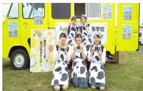
「しべパフェ」の取組(酪農・食品系列)

平成31年度より高校生OPENプロジェクトの指定を受け、地域の活性化に向けて「しべパフェ」を核にした町おこしについて企画及び調査・研究を行った。1年目は企業と連携して「しべパフェ」のデザインの作成、2年目に町と連携し「しべパフェ」の販売を中心としたPR、3年目となる今年度は「しべパフェ」の取組の中心を高校から町へ引き継いでいく。