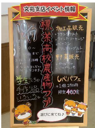
標茶高校フェアの開催(共通)

日専連釧路の協力をいただき、釧路市において初めて「標茶高校フェア」を開催した。生徒の学習成果を公開する場として貴重なイベントであった。特に研究班活動の説明(3系列では、ブースを設置し来場者の方々に説明を行った。また、実習成果品である加工品の販売(肉加工品5品目、乳製品4品目やしべパフェ)、カボチャやジャガイモなどの野菜を販売した。今年度初めて標茶高校の独自のイベントとして実施し、町外にも広く本校の教育活動を知っていただく機会となった。