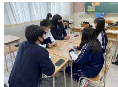
標茶町の観光資源の発掘と文化理解 (文化理解系列)

「標茶音頭」等、町の伝統や文化を体験・学習し、その中から新たな観光資源の発掘を行い、地域の活性化を図る。また、SDGsも学習に取り入れ、新たな取組を行っている。特に、町民の方々と積極的に交流を図りイベントの企画・運営にも参加してきた。更に、標茶町第5期総合計画に本校の取組が評価され、今後、計画策定に協力することになっている。