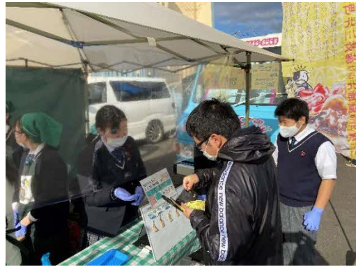
エゾ鹿の捕獲と有効利用(酪農・食品系列)

令和元年度、生徒自らが狩猟免許を取得し、校地内での「くくり罠」によるエゾ鹿の捕獲を行い、肉の加工、革製品の加工を行い、地域のイベントやノロッコ号でのおもてなし等で広く販売を行った。特に革製品のレザーストラップが観光客に大人気となり生徒の製造が間に合わないほどであった。捕獲から加工までの一連の学習により命の尊さを理解した上で、製品の販売に取り組んでいる。