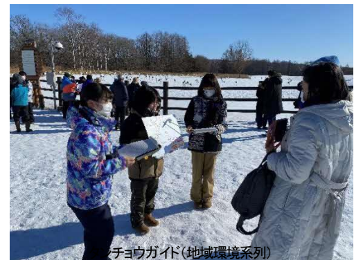
タンチョウガイド(地域環境系列)

鶴居村にある伊藤サンクチュアリと連携して観光で訪れた方にタンチョウヅルの生態や行動についての説明を行っている。年2回の実施であるが、このガイド学習に向けて現地のレンジャーの方からご指導いただき準備を進め、多くの人に説明を聞いていただいている。海外からの観光客も図や模型等に感動している様子も見られるなど、毎年、人気を集めている取組である。