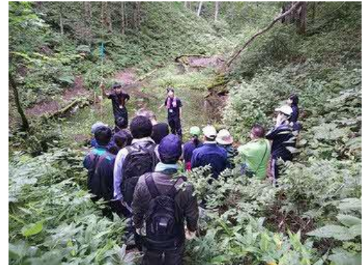
湿原環境及びドローンの活用(地域環境系列)

校地内にあるミニ湿原のビオトープや水源地等をフィールドとし、地域住民を対象に、学校の歴史と結び付けたガイド活動を行い、地域教育と環境教育を行っている。また、ノロッコ号運行時に車内において、生徒が観光客の方々に湿原の歴史等についてのガイドを行っている。今年度、その活動がYouTubeで紹介され、JR 東日本の中吊り広告に写真が掲載されるなど幅広く取り上げていただいた。